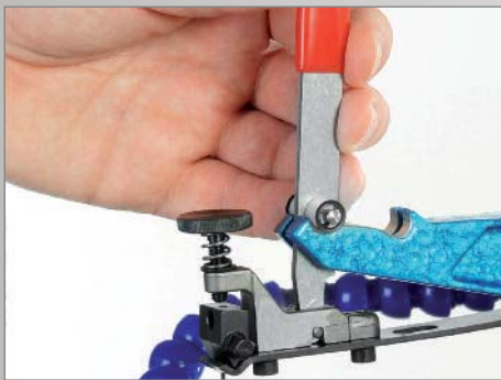
Exzenterpannung zur Sägeblattspannung