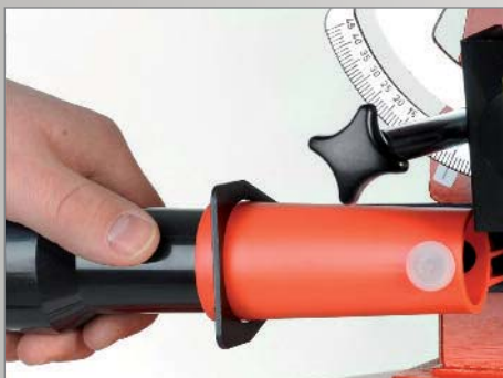
Zentraler Anschluss für obere und untere Absaugung (holzstaubgeprüft)