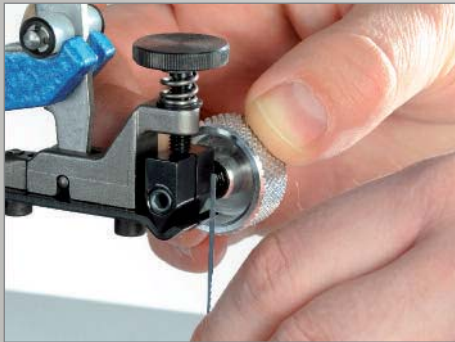
Schnelles Einfädeln bei Innenschnitten